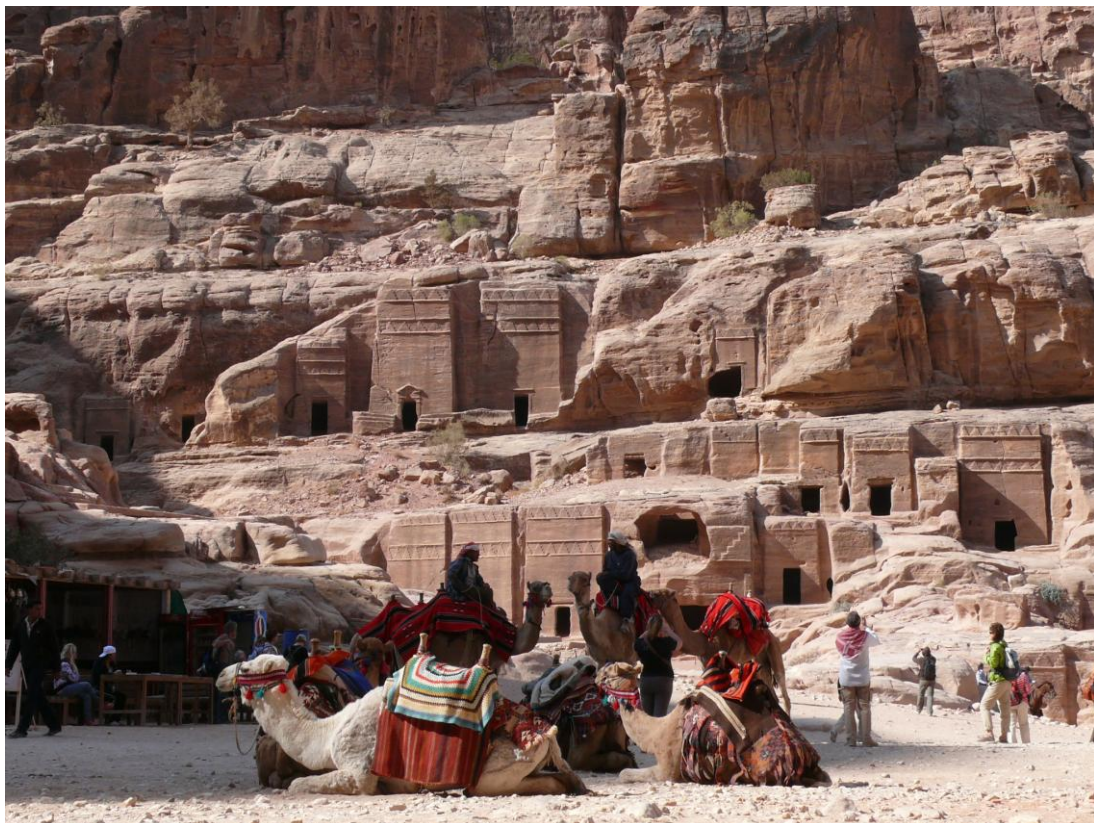
Halte sur la place de la ville basse de Pétra