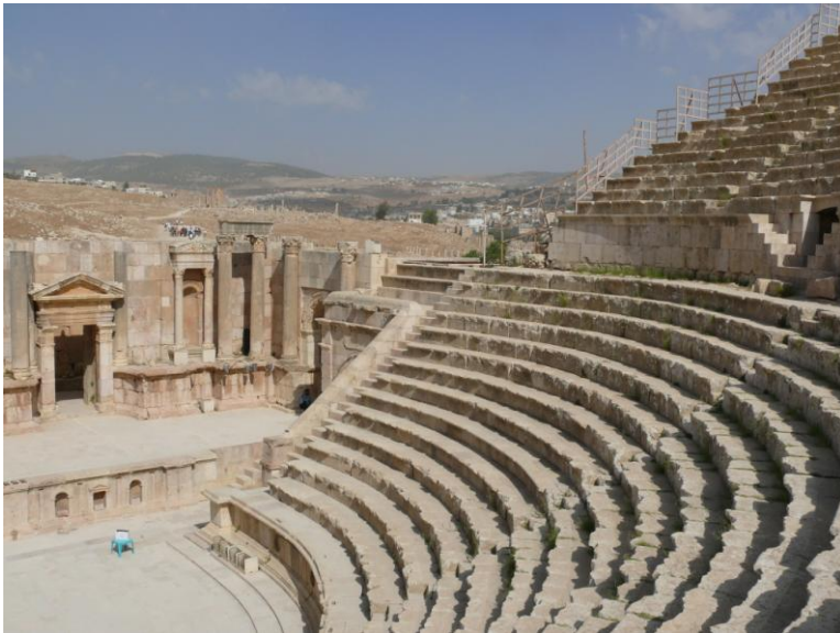
Le théâtre de Jerash